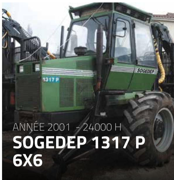
ANNÉE 2001 - 24000 H SOGEDEP 1317 P 6X6

Charge utile : 14 tonnes Moteur Cummins 270 cv Grue Cranab FC 106 portée 7,80 m Pneus 600 Trelleborg