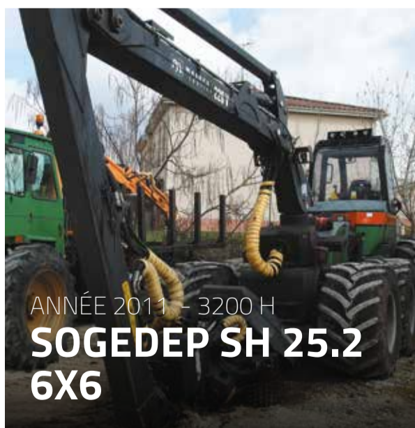
ANNÉE 2011 - 3200 H SOGEDEP SH 25.2 6X6

Grue HN 125 Tête H 73 (coupe) Pneus Nokian 600