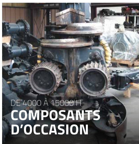
DE 4000 À 15000 H COMPOSANTS D'OCCASION

Tête Silvatec 560 (coupe 700 mm) Moteur Cummins 270 cv Grue Loglift 220 portée 8,30 m Pneus Trelleborg 600