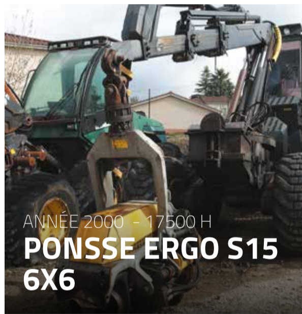
ANNÉE 2000 - 17500 H PONSSE ERGO S15 6X6

Charge utile : 13 tonnes Moteur Iveco 160 cv Grue Cranab 720 portée 7,20 m Pneus 600 Trelleborg