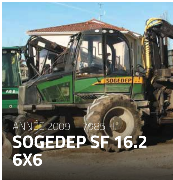
ANNÉE 2009 - 7985 H SOGEDEP SF 16.2 6X6

Charge utile : 12 tonnes Moteur Cummins 190 cv Grue Loglift 71 portée 10 m Pneus 700 Trelleborg