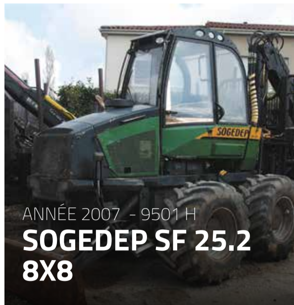
ANNÉE 2007 - 9501 H SOGEDEP SF 25.2 8X8

Charge utile : 12 tonnes Moteur Cummins 190 cv Grue Loglift 71 portée 10 m Pneus 700 Trelleborg