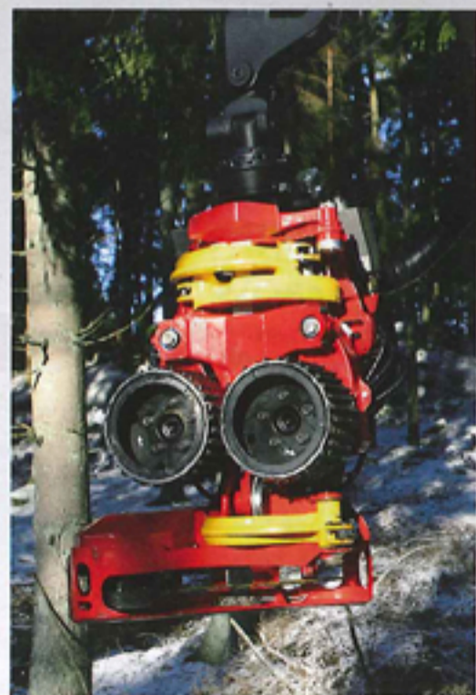
La tête d'abattage SP 451 LF peut couper des arbres jusqu'à 55 cm.

L'abatteuse SH15 disposera d'une grue de plus de 7 mètres de portée et pourra être équipée de deux têtes d'abattage SP de conception suédoise. Pour la récolte de bois-énergie, l'entrepreneur de travaux forestiers pourra choisir une tête SP 401 EH, capable de réaliser la coupe d'arbres de faibles diamètres et disposant d'un bras accumulateur pouvant contenir jusqu'à 8 brins de 10 cm de diamètre. Par ailleurs, il sera également possible d'équiper la future abatteuse SH15 d'une tête d'abattage SP 451 LF permettant, quant à elle, un abattage jusqu'à 53 cm et un ébranchage jusqu'à 35 cm. Cette dernière tête sera également pourvue d'un bras accumulateur capable de rassembler trois arbres de 15 cm de diamètre.