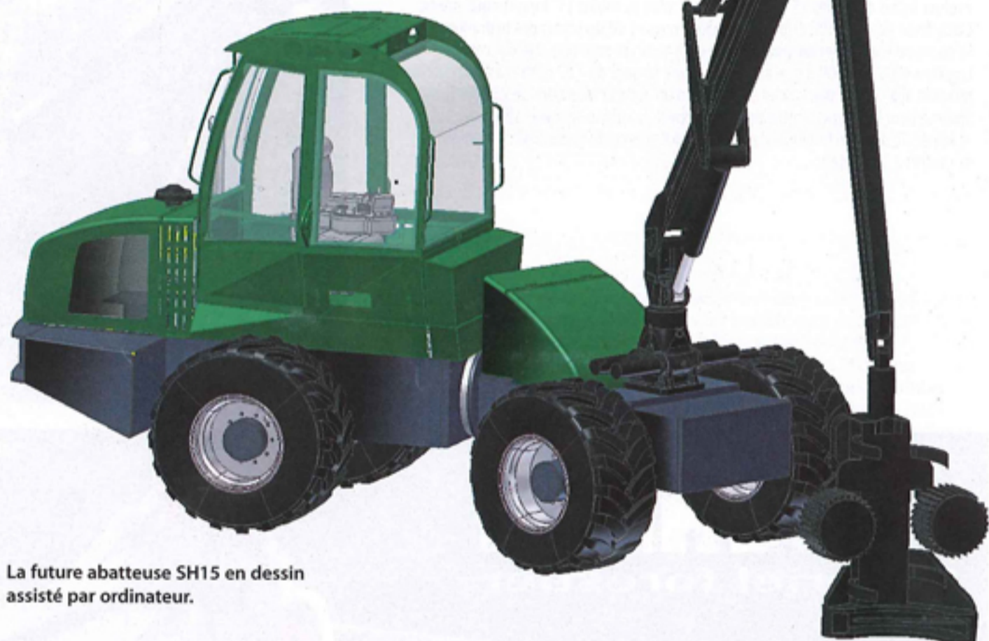
La future abatteuse SH15 en dessin assisté par ordinateur.

Le constructeur français Sogedep travaille actuellement à l'élaboration d'une abatteuse très maniable adaptée aux petits bois comme au bois-énergie avec un faible encombrement. L'objectif est de concevoir un engin très rapide d'exécution pour un prix compris entre 260 et 280.000 euros. Ce modèle SH15 sera commercialisé pour Forexpo 2012 après des essais grandeur nature qui débiteront dès décembre 2011.